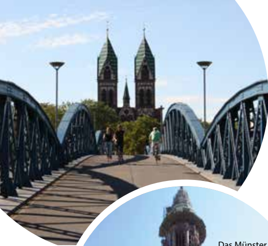
Die Herz-Jesu-Kirche im Stühlinger